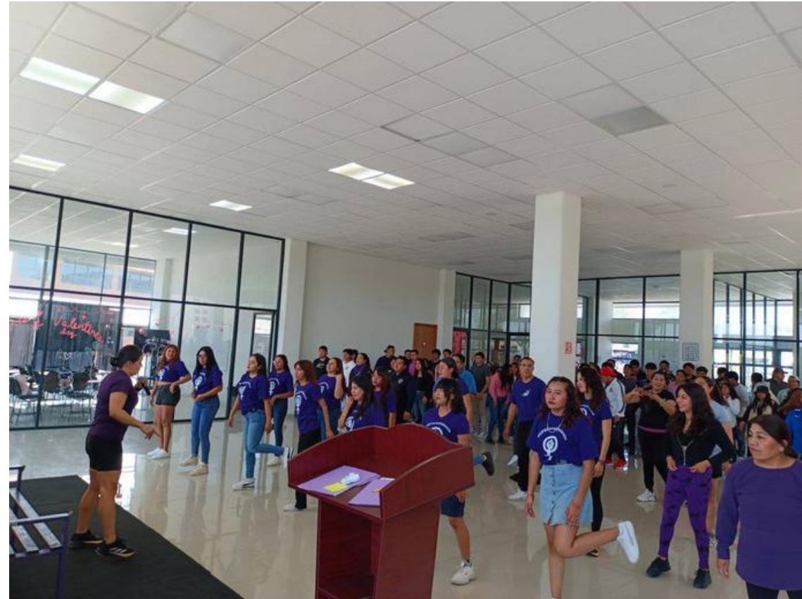
Activación física “Fuerza Violeta”.