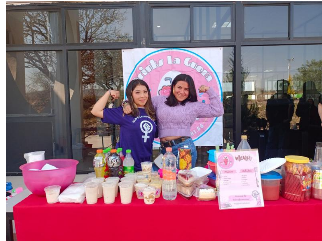
Mercadita de Emprendedoras.