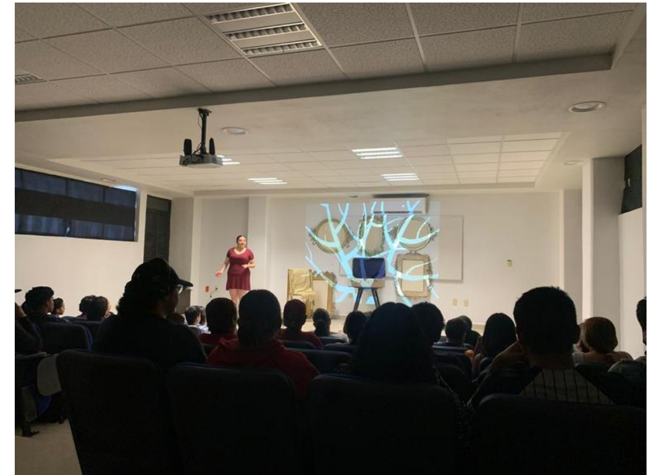
Obra de teatro “Matrioskas: reivindicación del silencio transgeneracional”, a cargo de Revolver Escena.