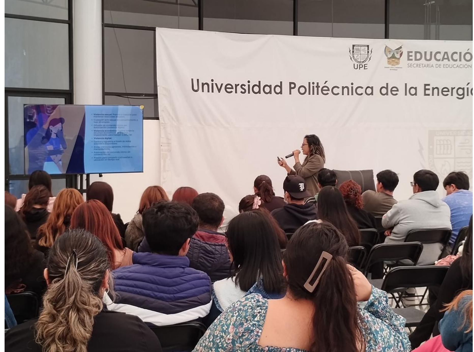
Conferencia “Violencia en el Noviazgo” impartida por el Centro de Integración Juvenil A.C.